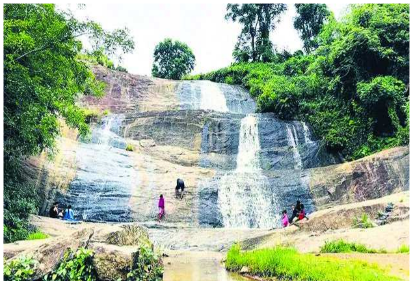
అనంతగిరి, : మండలంలోని ప్రముఖ పర్యాటక కేంద్రమైన తాటిగుడ జలపాతం వద్ద నిర్లక్ష్యం లోపం పర్యాటకులకు శాపంగా మారింది. ప్రకృతి అందాలను ఆస్వాదించడానికి

వచ్చే పర్యాటకులు ఇక్కడి పరిస్థితిని చూసి నిరుత్సాహానికి గురవుతున్నారు. తాటిగుడ జలపాతం వద్ద గతంలో కనీసం సౌకర్యాలు ఉండేవి కావు. అయితే తొమ్మిదేళ్ల క్రితం అప్పటి టీడీపీ ప్రభుత్వ హయాంలో పర్యాటక శాఖ అధికారులు రూ.30 లక్షలతో ఇక్కడ సదుపాయాలు కల్పించారు. జలపాతాన్ని ఆనుకుని వ్యూపాయింట్ నిర్మించి, పర్యాటకుల సౌకర్యార్థం మినీ రెస్టారెంట్, స్నానం చేసిన తరువాత దుస్తులు మార్చుకునేందుకు రెండు రూమ్లు, అలాగే జలపాతం వద్దకు వెళ్లేందుకు మెట్లను నిర్మించారు. అంతా బాగానే ఉన్నా నిర్లక్ష్యం లేకపోవడంతో ప్రస్తుతం అధ్వానంగా తయారైంది. పిచ్చిమొక్కలు దట్టంగా పెరగడంతో మినీ రెస్టారెంట్ వద్దకు, దుస్తులు మార్చుకునే గదుల వద్దకు వెళ్లడానికి అవకాశం లేకుండా ఉంది. పైగా విష కీటకాలు ఉంటాయేమోనని పర్యాటకులు భయపడుతున్నారు. అలాగే మెట్ల పైనుంచి నీరు పారుతుండడంతో కొంత వరకు నాచుపట్టి ప్రమాదభరితంగా మారింది. మెట్లను ఆనుకుని ఉన్న ఇసుక రయిలింగ్ వద్ద ఇరువైపులా పిచ్చిమొక్కలు పెరిగిపోవడంతో పాములు ఉన్నాయేమోనని పర్యాటకులు ఆందోళన చెందుతున్నారు. అలాగే ఎత్తైన ప్రదేశంలో పంట పొలాను ఆనుకుని నిర్మించిన వ్యూపాయింట్ వద్ద ఉన్న స్టిల్ రయిలింగ్ ఉడిపోతుండడంతో పర్యాటకులు ఎప్పుడు ఏం జరుగుతుందోనని భయపడుతున్నారు. ఇప్పటికైనా పర్యాటకశాఖ అధికారులు స్పందించి ఇక్కడ సౌకర్యాలను కల్పించడంతో పాటు సక్రమంగా నిర్వహణ చేయాలని పర్యాటకులు కోరుతున్నారు.